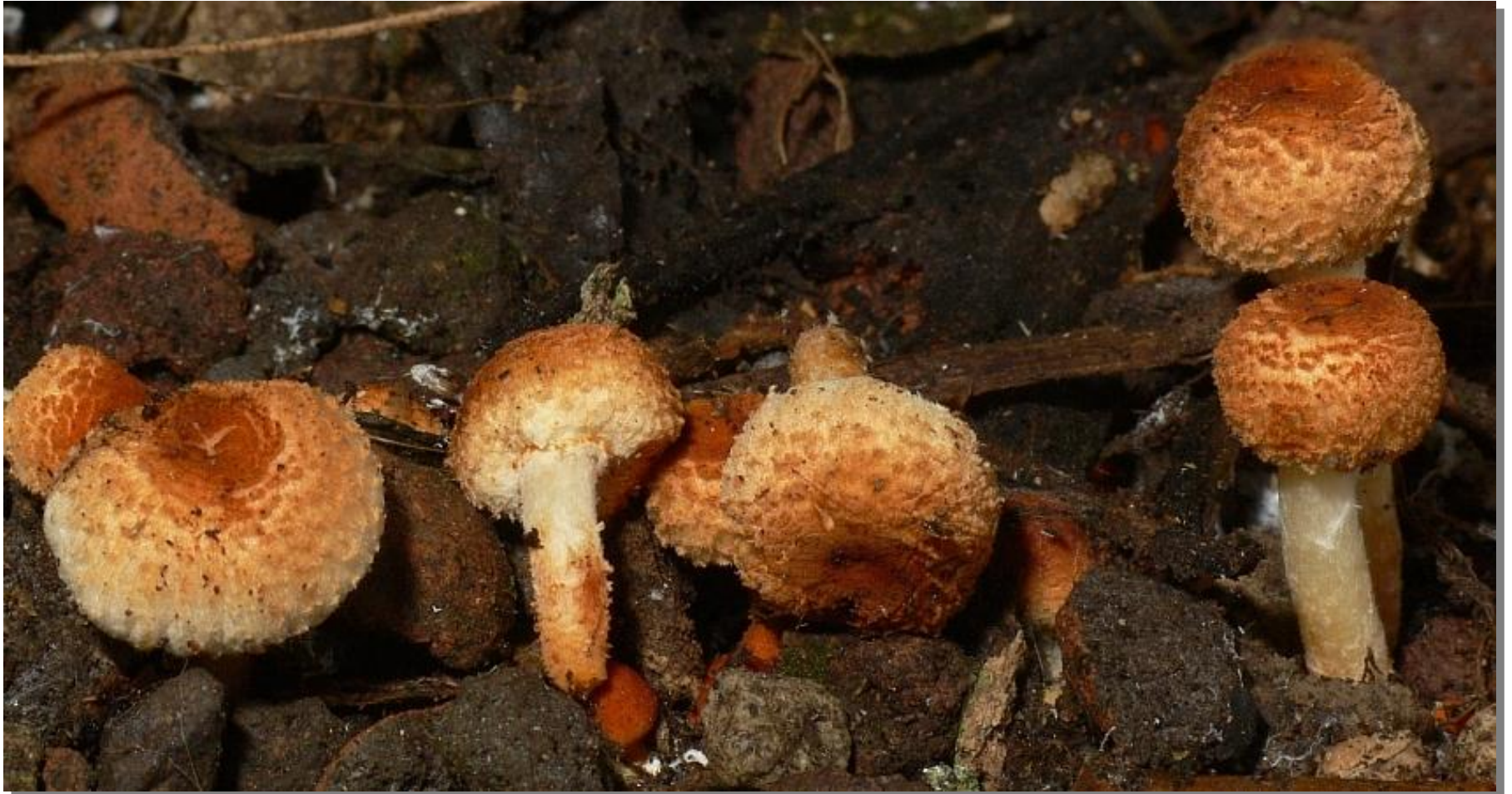
Leucoagaricus rubrobrunneum nom .prov. (F 79, 121)